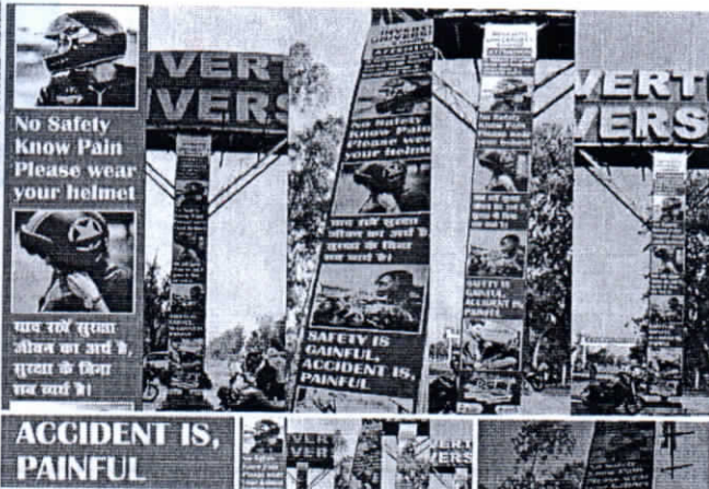
Press Release 04-06-2019